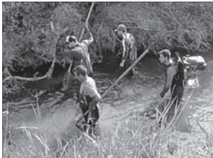
Angler des Angelsportvereins Unterbaldingen bei der Elektrobefischung

Nach der Planungsphase steht in den nächsten Wochen die naturnahe Umgestaltung der Kötach im Bereich des Unterbaldinger Sees an. Über eine Streckenlänge von ca. 1000 Metern soll die in diesem Bereich besonders stark eingetieft und naturferne Kötach wieder einen Verlauf mit Verschwenkungen und zahlreichen strukturbildenden Elementen erhalten.