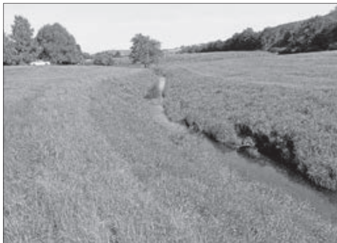
Naturferne Kötach zwischen Unterbaldinger See und A81

Diese Besonderheit macht es nun erforderlich, auch die Muscheln zu bergen und umzusiedeln. Muscheln übernehmen zudem weitere wichtige ökologische Funktionen wie die Filtration von Gewässern. So kann eine Bachmuschel ca. 3 bis 4 Liter Wasser pro Stunde filtrieren. Das filtrierte Volumen pro Tag liegt bei ungefähr 85 Litern pro Muschel. Bei gesunden Populationen sind diese somit in der Lage, innerhalb einer kurzen Distanz den gesamten Wasserkörper zu filtrieren.