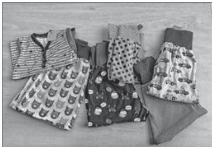
von Hand angefertigte Waren des „lustigen Nähkörnchens“

Unter dem Motto „Wir brauchen Platz für Neues“ werden Strickwaren und Selbstgenähtes, wie Jacken, Socken, Taschen, Schals, genähte Kinder- und Babybekleidung und vieles mehr angeboten. Es finden sich also Modehighlights für Jung und Alt.