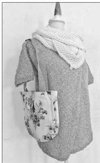
rosa Pulli mit Schal