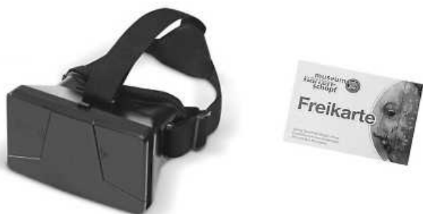
360° Home Edition Plus: VR-Brille und Freikarte fürs Museum