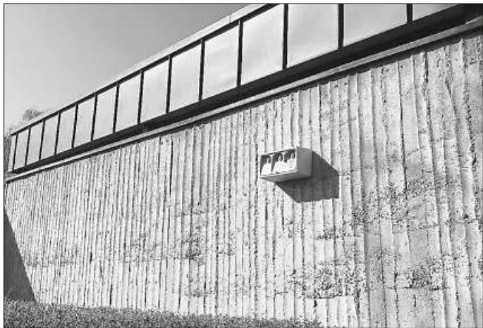
Einer der 35 neuen Nistkästen am Bad Dürrheimer Friedhof

Der städtische Bauhof hat im Bereich des Friedhofs rund 35 Nistkästen für diverse Vogelarten aufgehängt. Zudem wurden am Rathaus drei Doppelkästen für Mauersegler angebracht. Um brütenden Vögeln einen sicheren Unterschlupf zu bieten, haben Mitarbeiter des Bauhofs diese Woche mehrere Nistkästen für Vogelarten wie Star, Kleiber oder Sperling rund um den Friedhof der Kernstadt aufgehängt. Dies dient als Ausgleichsmaßnahme für das Neubaugebiet Herrngarten und berücksichtigt die Tatsache, dass durch Dachsanierungen immer mehr Nistplätze für Vögel wegfallen.