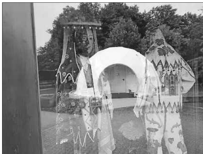
Ein besonderes Erlebnis: Fastnacht in der 360°-Projektionskuppel

Seit Juli ist das 360°-Kino im Narrenschopf in Betrieb. Die Besucher sitzen hier mitten im Fastnachtsgeschehen und können verschiedene Bräuche 360° um sich herum erleben. Gruppen ab 10 Personen können sich jederzeit für eine Vorführung anmelden - mit oder ohne Museumsbesuch. Für Einzelbesucher ist die 360°-Projektionskuppel donnerstags von 14-17 Uhr und sonntags von 14-16 Uhr geöffnet.