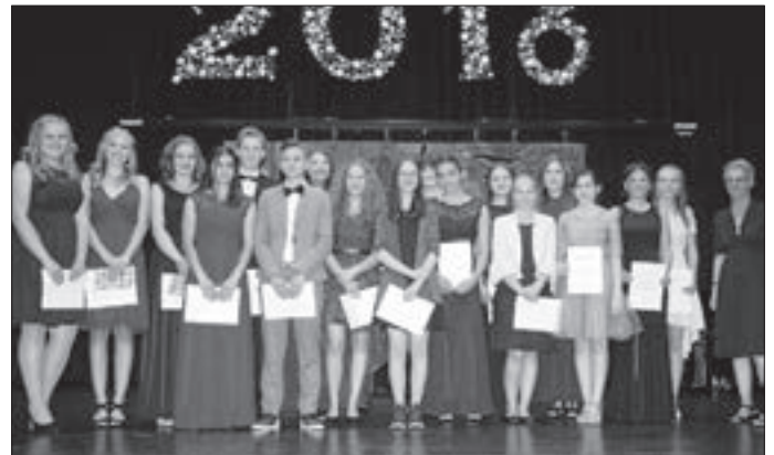
Für besonders gute Leistungen wurden diese Schülerinnen und Schüler der Realschule Am Salinensee zum Schulabschluss mit Loben und Preisen bedacht.